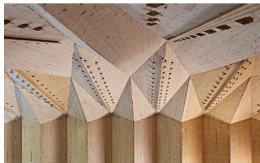
Détails de la construction en bois au Théâtre de Vidy