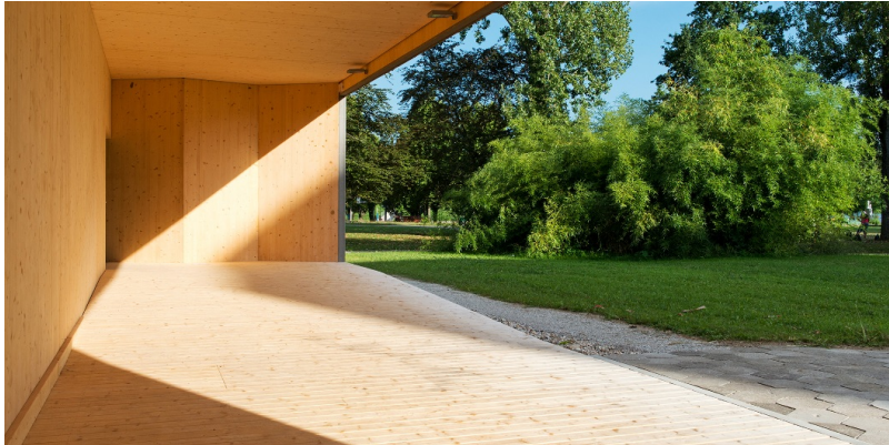
Hall d'entrée du Théâtre de Vidy