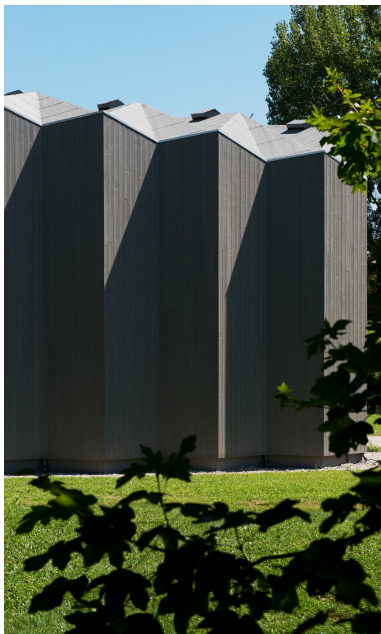
Structure porteuse qui semble «pliée»