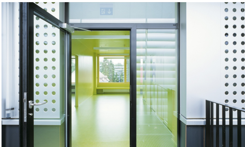
Espace d'entrée spacieux dans le bâtiment d'école temporaire