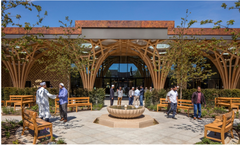
Vue de la cour intérieure de la mosquée