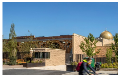
Vue extérieure de la mosquée de Cambridge