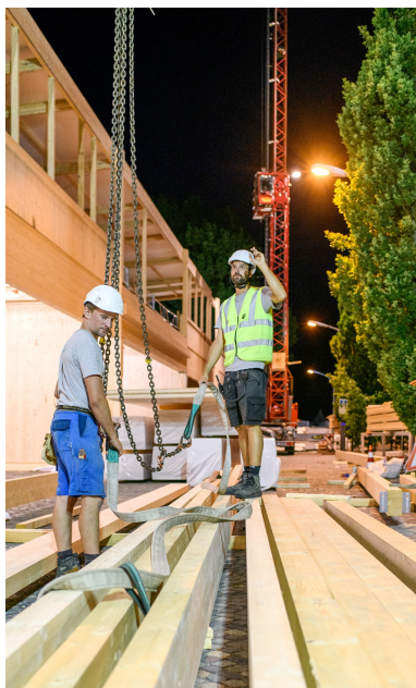
Montage de construction en bois en un temps record