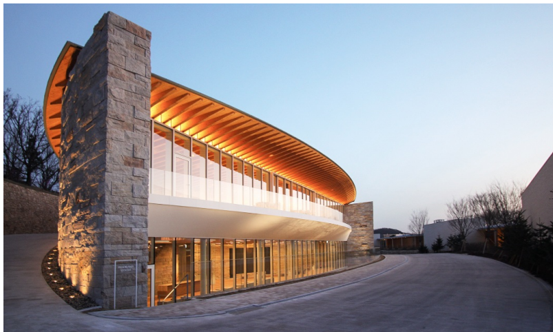
Club de golf Haesley Nine Bridges, Learning Centre de nuit