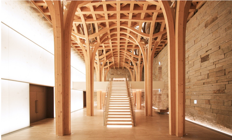
Escalier dans le Learning Centre