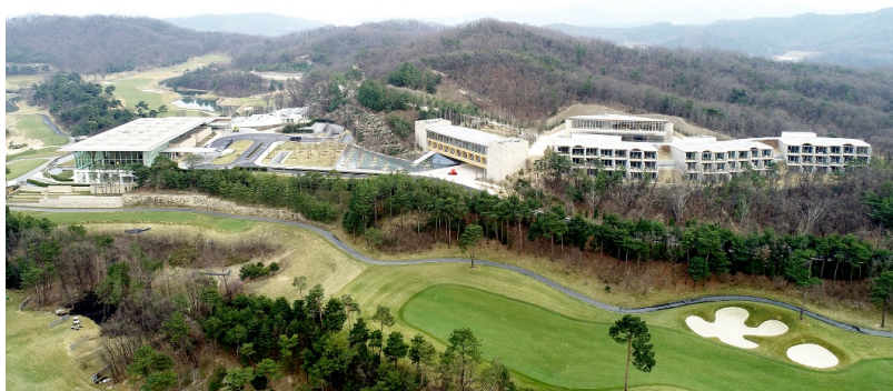
Vue aérienne des tous les bâtiments