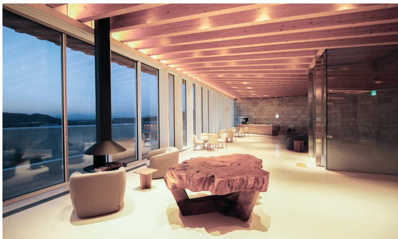
Les remarquables poutres en bois du plafond créent une atmosphère agréable dans le patio du Recreation Centre.