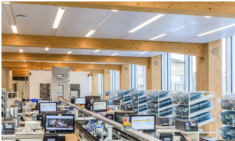
Postes de travail modernes pour la production