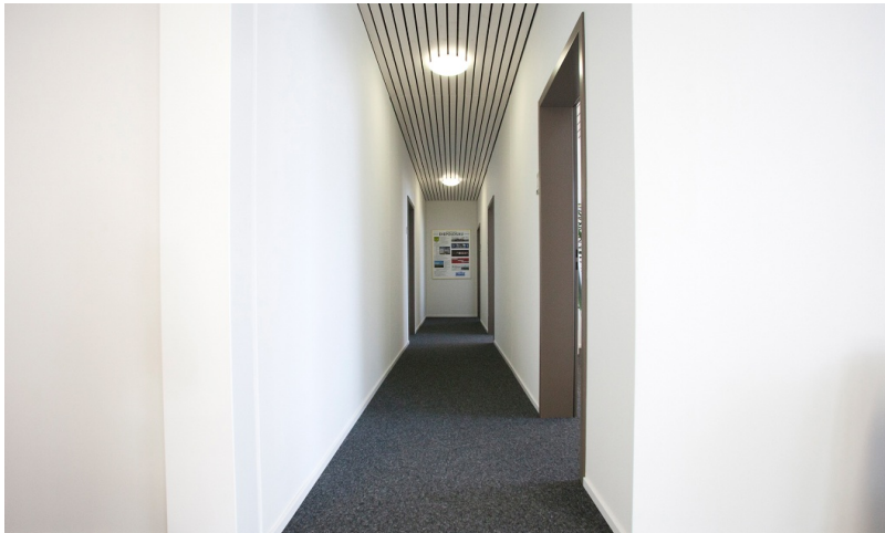
Helle Korridore im Backoffice