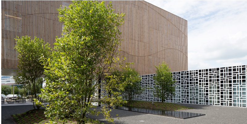
Fassadengestaltung mit vertikaler Douglasienlattung