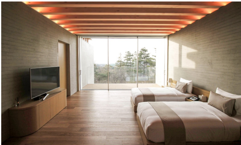
Elegantes Schlafzimmer im Condo-A- Apartmenthaus