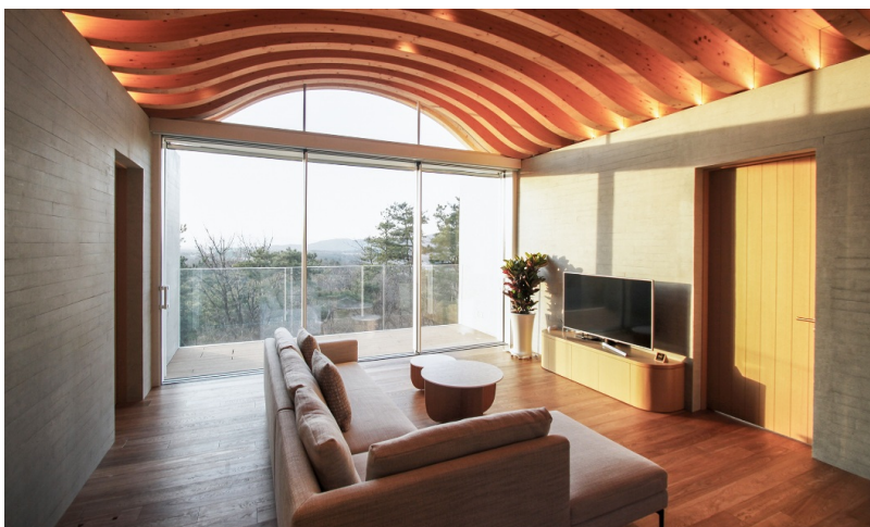
Stilvoller Innenausbau und geschmackvoll eingerichtet: Suite im Condo A.