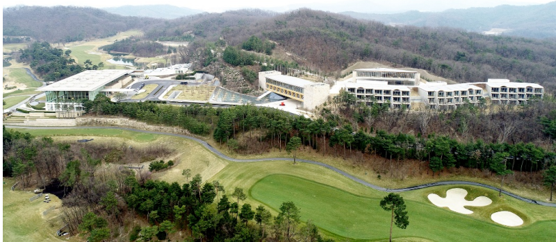
Alle neuen Gebäude des Haesley Nine Bridges Golfklubs im Überblick.